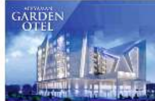
Garden Adıyaman Hotel Adres: Milli Akademi Sok. 1. Kat Kat: 1 Adıyaman - Turkey Rezervasyon : 0 412 219 1888