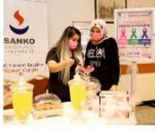
pembe maskeler dağıtarak, kemoterapi öncesi pembe bantlarla süsledi. Haber: Mehmet Ünsal

Standta Meme Kanseri Farkındalık Ayı'nın anlamını sembolize eden pembe turlerle ve