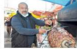
Karadeniz bölgesinin ürünlerini Bileciklier tatıyor.