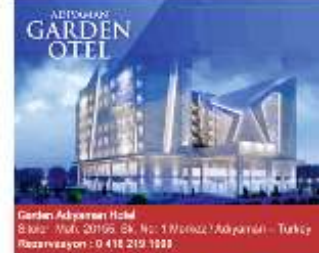
Garden Adıyaman Hotel Sizce: Mülk. 20199. Sk. No: 1 Merkez Adıyaman - Türkiye Rezervasyon: 0 418 209 1000

Mersin'de kurdukları sanal jigolo sitesi aracılığıyla 68 kişiyi dolandırdığı iddiasıyla 8 kişi gözaltına alındı. Mersin merkezli 4 ilde gerçekleştirilen operasyonda şüphelilerin yaklaşık 1 milyon 100 lirası dolandırdıkları ve lüks bir hayat sürdükleri tespit edildi.