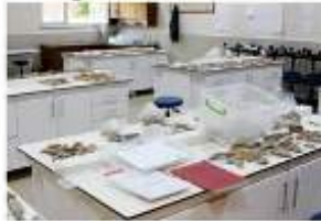
Adıyaman'ın arkeolojik anlamda çok zengin bir potansiyele sahip olduğunu belirten

50 arkeolojik yerleşim ise arkeolojik literatürüne kazandırılarak tasvirlenmiştir.